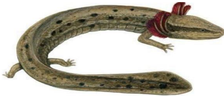
Necturus maculosus السلمندر