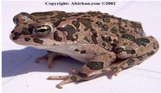
الضفدع الامريكي Bufo viridis