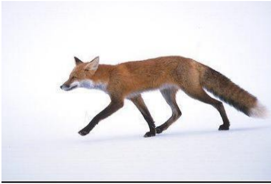
الثعلب Vulpes vulpes