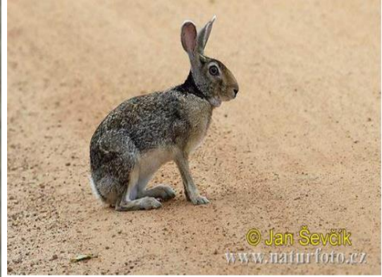
الارنب Lepus او Oryzolagus cuniculus