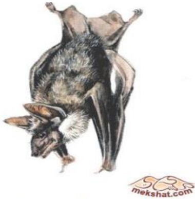
الخفاش Taphozous nudiventris