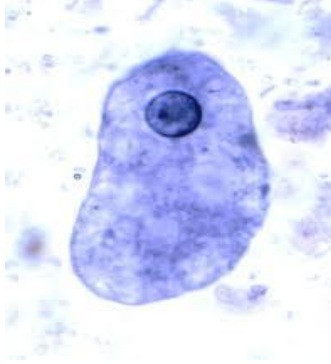
طور النشطة لاميبا الحالة للنسيج ( Entamoeba histolytica trophozoite)